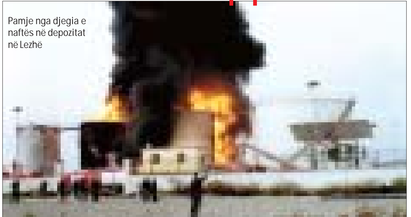
Pamje nga djegia e naftës në depozitat në Lezhë

Laguna e Knallës ende vazhdon të jetë e mbuluar me naftën e depozitave